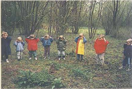
"A l'écoute des oiseaux"

■ la section des grands s'est rendu à la maison du papier d'Esquerdes.