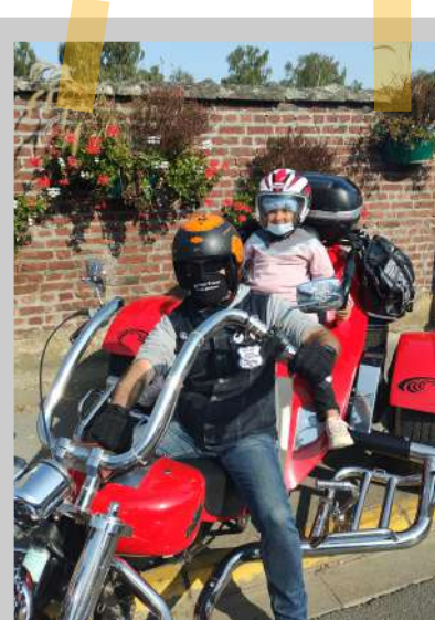
Baptêmes avec les Ch'tis Trikes