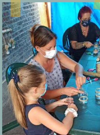
Atelier de créations florales avec "Effet bois et fée main"