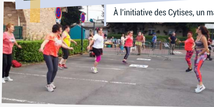
Démonstration de Zumba avec les Cytises