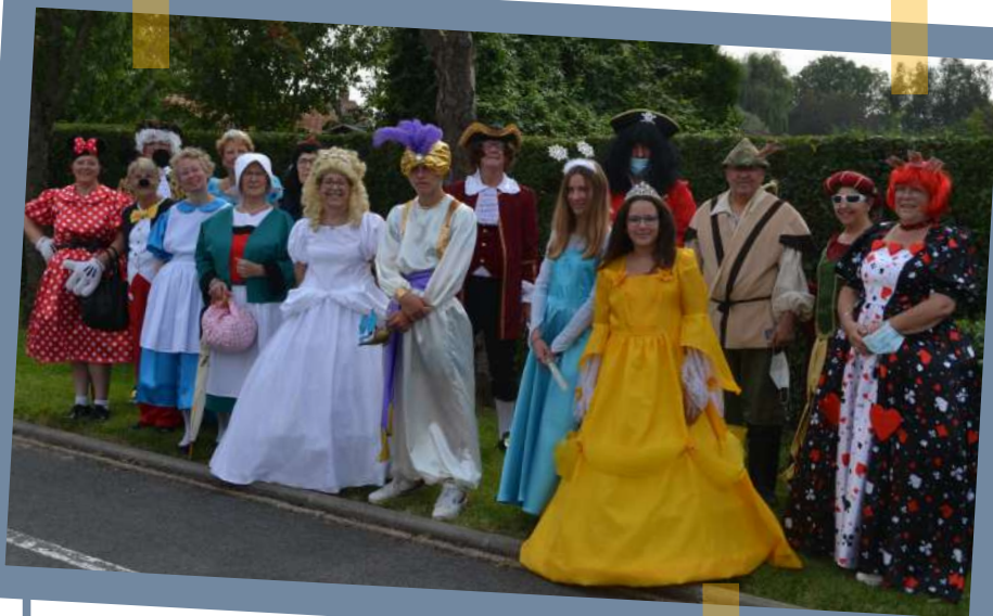
Personnages costumés avec Créastyl 2000