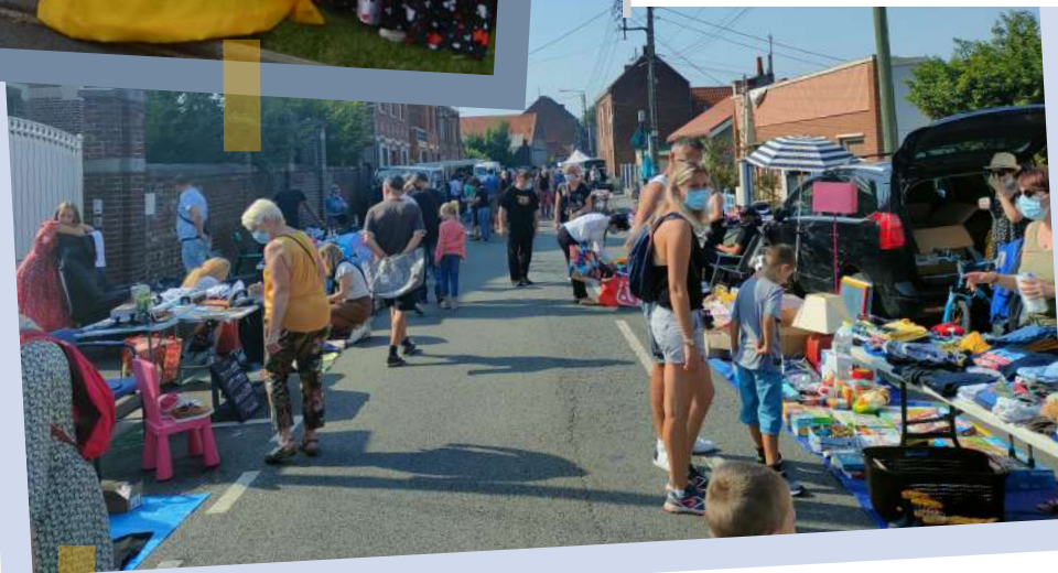
À l'initiative des Cytises, un marché aux puces convivial