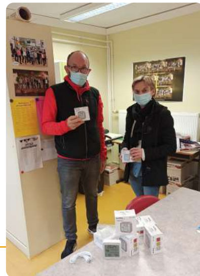
→ École primaire J. Poteau