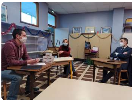
↑ École primaire J. Jaurès