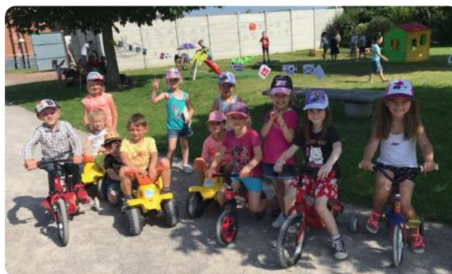
Accueil de Loisirs (été)