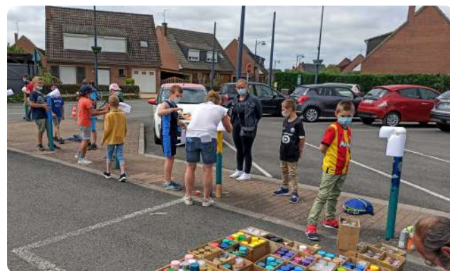
Festival des Petits Bonheurs

Visite virtuelle de l'église de Billy-Berclau