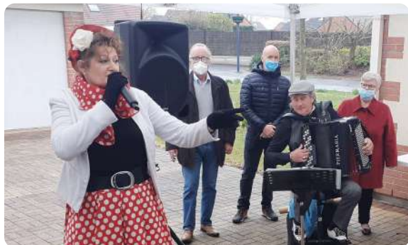
Animation à l'Ehpad