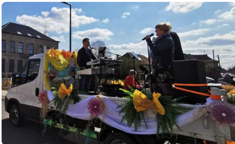
Parade en ville