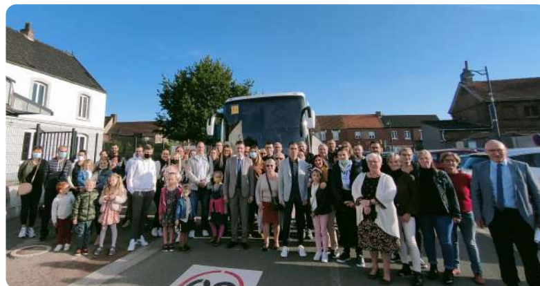
Nouveaux habitants et bébés 2021