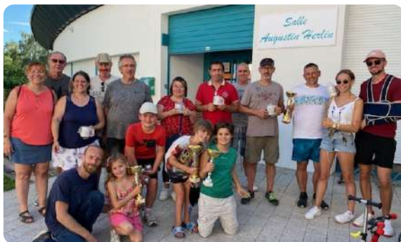
Animation durant l'été