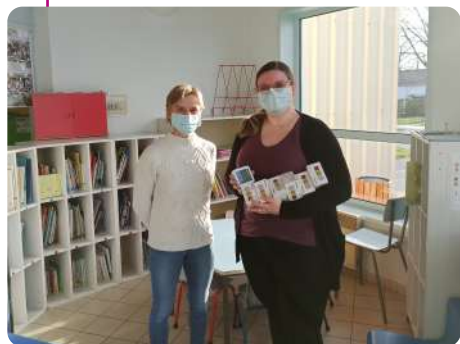
↓ École maternelle C. Debussy

Ces capteurs mesurent la concentration en CO 2 et permettent ainsi d'évaluer facilement le niveau de renouvellement d'air.