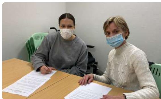
Bourse au permis