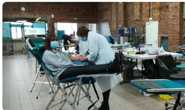
Don du sang