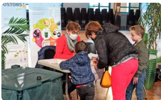
Livraison des composteurs