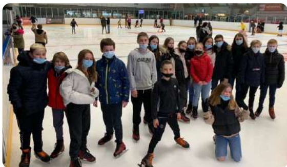
Sortie patinoire du CAJ