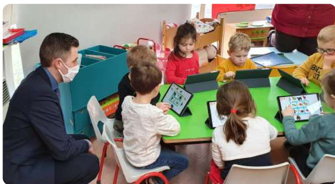
Tablettes pour les maternelles