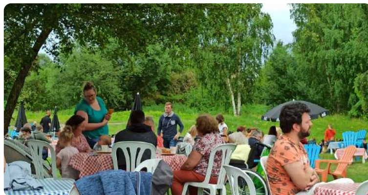
Guinguette à l'Île aux Saules