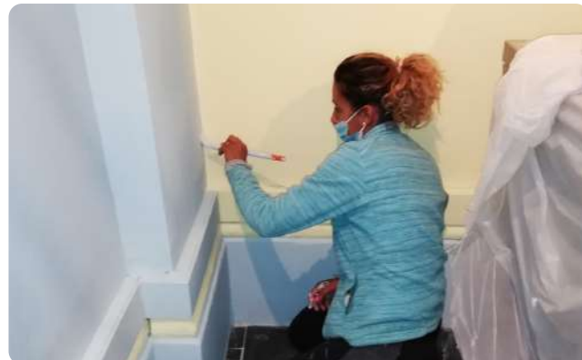
Restauration de l'église