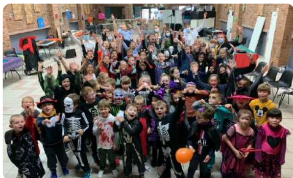
Accueil de Loisirs (hiver)