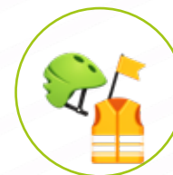
MATÉRIEL DE SÉCURITÉ

NEUF 70€ 300€ 500€ 200€ 500€ 30€ OCCASION -