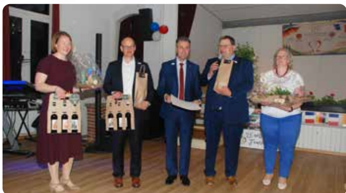
Des cadeaux ont été échangés. Un cadre souvenir des 25 ans de jumelage a été remis au Maire de Weilrod et une bouteille de bière spéciale jumelage de la Brasserie "Les Crapauds Fous" à chaque participant.