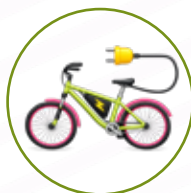
VÉLO ÉLECTRIQUE Y COMPRIS RETROFIT